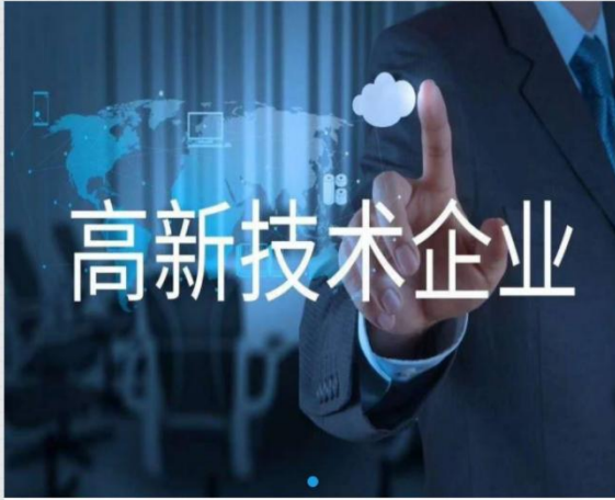
关于组织开展2022年高新技术企业的通知